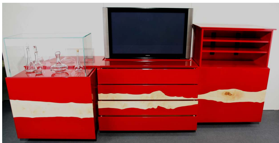
Komplett ausgefahrenes Flatlift 50 Karat Diamant Sideboard

Technisch ist das Sideboard auf dem neuesten Stand: Ein unsichtbar eingebauter 42-Zoll-Flachbildschirm fährt bei Bedarf per Fernbedienung automatisch nach oben. Das entstehende Loch unter dem TV wird für eine perfekte Optik anschließend von einer bündig abschließenden, lackierten Holzplatte verschlossen. Eine integrierte Bar aus Glas erscheint auf Wunsch per Knopfdruck ebenso von selbst wie das Hi-Fi-Rack auf der rechten Seite. Die vier Schubladen in der Mitte öffnen und schließen bei leichtem Antippen motorbetrieben und geräuschlos. Für zusätzliche Glanzeffekte sorgt auf der Rückseite und am Sockel ein umlaufendes LED-Band, das stufenlos auf 1,4 Millionen Farben einstellbar ist.